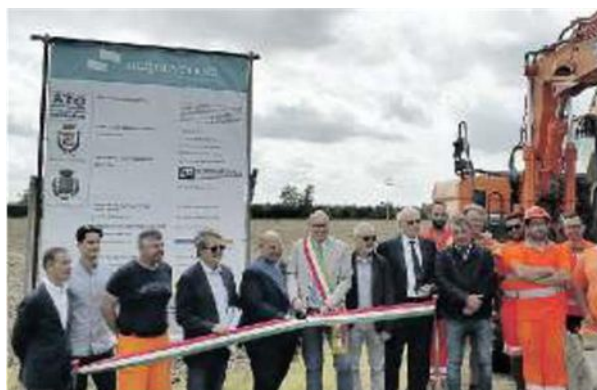
CANTIERE Posa della prima pietra per l'ampliamento della Sp42